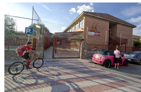
Fachada del colegio de Soto del Real donde el menor fue acosado de forma reiterada.

Ocurrió hace cuatro años pero es ahora cuando lo ha confirmado una sentencia del Juzgado Contencioso Administrativo 21 de Madrid. El fallo condena a la Comunidad de Madrid a pagar 18.000 euros de indemnización al menor.